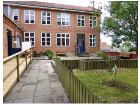
Viborg Pilgrimshus "Herberget"