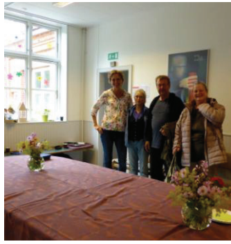
Fra indvielsen af "Herberget"