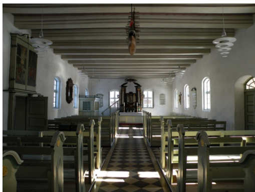
Hertug Hans' kirke

Her er link til omfattende info om Camino Haderslev Næs: